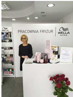
Moja praca-moja pasja